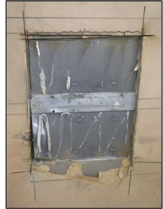
Foto della prova di resistenza all'azione manuale di effrazione con attacco dal lato esterno secondo la norma EN 1630:2016