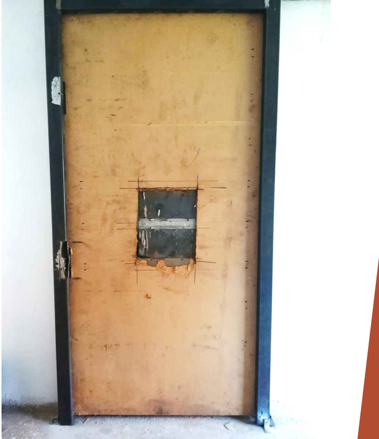
Foto campione dopo la prova RC5